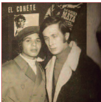
Camarón y Paco de Lucía.

L a ciudad que vio nacer a uno de los grandes mitos del flamenco del siglo XX, Camarón de la Isla ha preparado una exposición titulada 'Camarón vive. 25 Años. Mito, leyenda y revolución' que da a conocer algunos de los hitos más destacables en la vida y la obra del artista a través de cinco bloques temáticos. Su inclinación por la guitarra, su pasión por el toreo, su relación con la Chispa , el amor de su vida; su complicidad con Paco de Lucía y la revolución que supuso la grabación de 'La leyenda del tiempo'. Se recorre a través de imágenes (inéditas en su mayoría) sus vivencias, sus relaciones y aficiones con respecto a estos cinco ejes vitales de su carrera profesional y su vida afectiva/emocional.