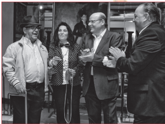
Grupo flamenco extremeño.