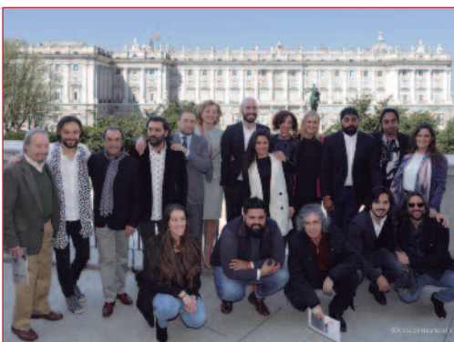
Presentación Suma Flamenca.

L a XII edición del Festival de la Comunidad de Madrid Suma Flamenca convertirá a la región en escenario del mejor flamenco, presentando al público madrileño lo más destacado del cante, la música y el baile. El festival arranca el 1 de mayo con la presentación del nuevo disco de Vicente Amigo. Su programación completa será del 6 al 25 de junio, con un total de 26 espectáculos en 13 escenarios diferentes.