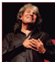
José Mercé.