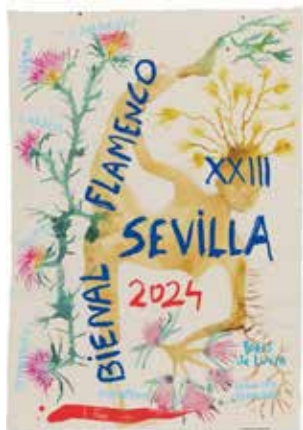
El cartel es obra de Miquel Barceló