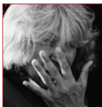
José Mercé

E n la temporada 2024, el Teatro de la Zarzuela ha programado dos grandes conciertos flamencos. Mayte Martín , el 14 de mayo, en un concierto en el que presentará su próximo trabajo discográfico dedicado al flamenco. Cantora y también compositora, recibió la Medalla de Oro en las Bellas Artes en 2021. Mayte Martín: 14 de mayo 2024. El otro gran concierto lo dará el cantaor jerezano José Mercé , que presentará su trabajo 'Flamenco', el 25 de junio 2024.