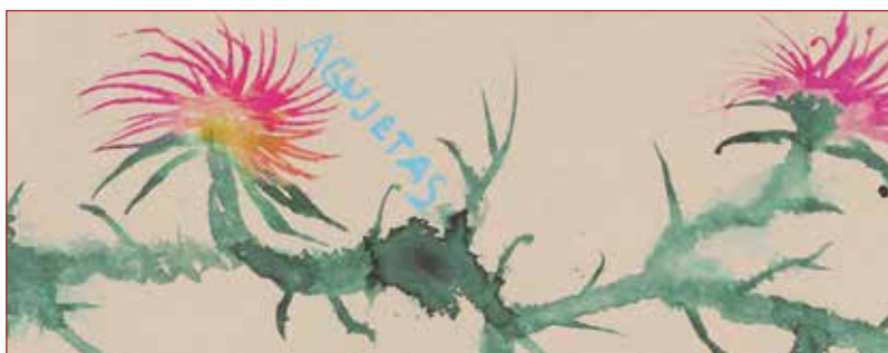
Fragmento del cartel de Miquel Barceló para la Bienal de Sevilla

U no de los problemas que tenemos los aficionados al flamenco y más aquellos que tenemos una tribuna (casi todos, hoy día) es saberlo todo o casi todo. Como si por conocer que esta soleá se le adeuda a tal maestro o aquella siguiirya a este otro nos da permiso para ser expertos también en el arte pictórico o escultórico. Y cualesquiera área del conocimiento, faltaría más.