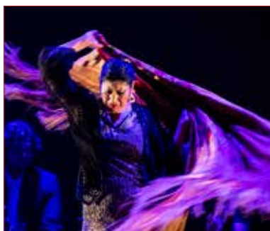
Manuela Carrasco

El 9 de marzo se clausura el Festival con un icono del baile flamenco, la gran Manuela Carrasco, que presenta en estreno absoluto la que será su gira de despedida. Una cita emotiva que promete pasar a las páginas doradas del Festival de Jerez.