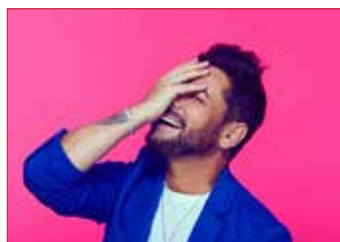
Miguel Poveda vuelve a La Unión

El Festival Internacional del Cante de las Minas ha dado a conocer el cartel de artistas de la 63ª edición. El Festival, que tendrá lugar del 31 de julio al 10 de agosto, contará con la presencia de Miguel Poveda, Pitingo, el Ballet Nacional de España, «Las Minas Flamenco», con Eduardo Guerrero, David Palomar y Fernández del Moral, netre otros. Además, el concurso internacional tendrá lugar los días 7, 8 y 9 de agosto, y la Gala Final el 10.