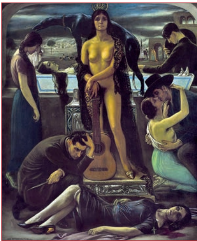
Cante hondo, 1924, Julio Romero de Torres, en su Museo en Córdoba