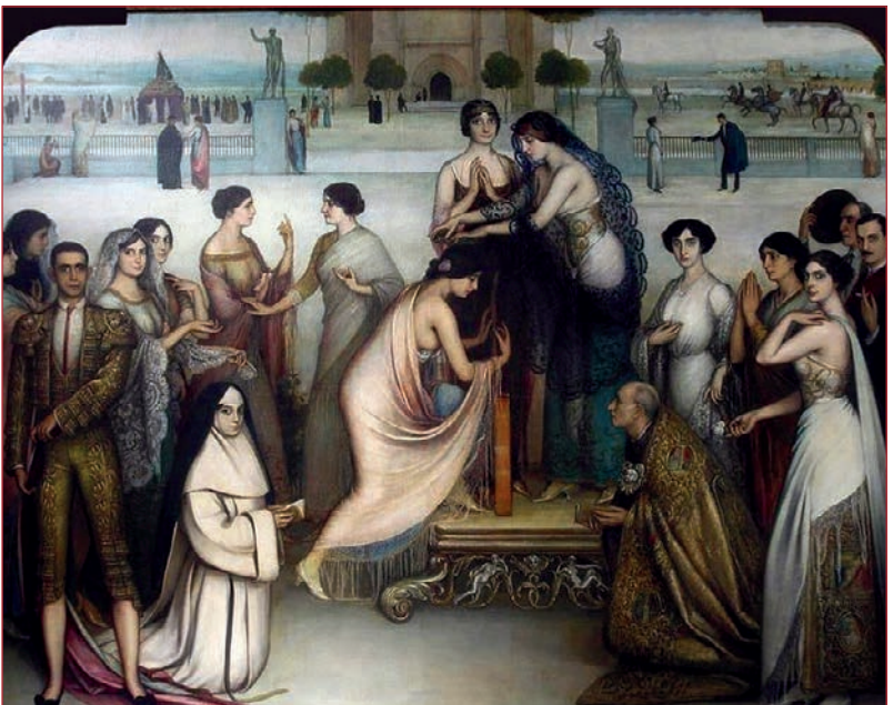
La consagración de la copla, 1912, Julio Romero de Torres

En la primera década del siglo se instala en Madrid, donde interactúa con otros pintores y escritores en una etapa de creatividad extraordinaria, en la que los nuevos estilos: modernismo y simbolismo empiezan a mostrarse en las obras. Forma parte de las tertulias del café Nuevo Levante, liderada por Ramón del Valle-Inclán, o las del café Pombo, presidida por Gómez de la Serna.