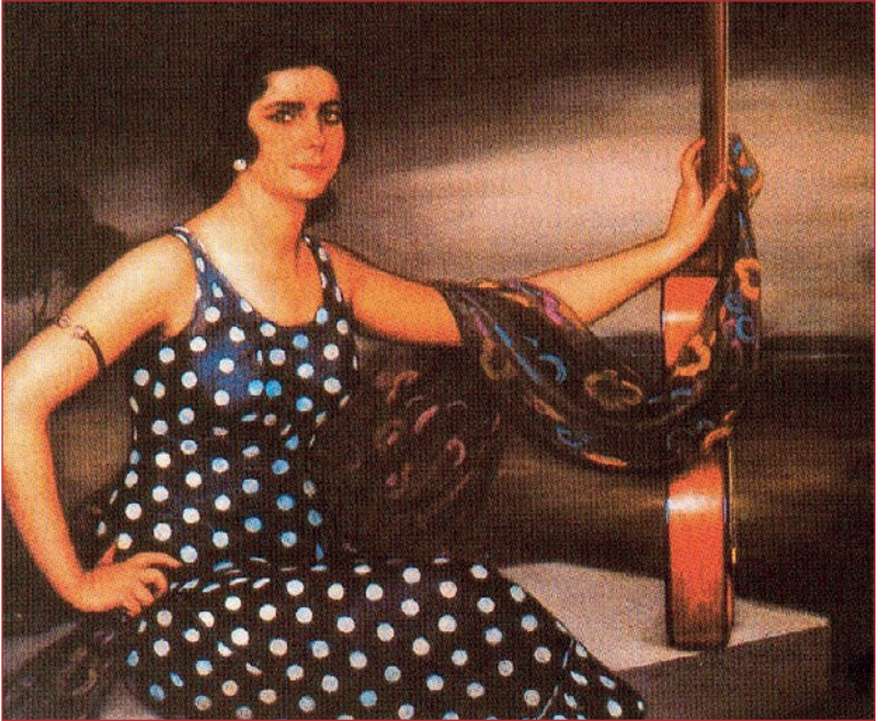
Pastora Imperio (1922).

S e cumplen 150 años del nacimiento de uno de los pintores más ligados a la iconografía del flamenco: Julio Romero de Torres. Nacido en Córdoba en 1874, y comenzó a pintar de niño, en casa, con su padre, el artista y profesor Rafael Romero Barros, director del Museo de Bellas Artes de Córdoba.