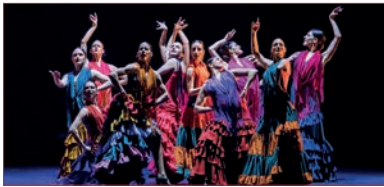
Ballet Nacional de España.

El flamenco Festival vuelve a Londres, del 4 al 15 de junio. Esta cita en el Sadler's Wells Theatre acogerá las propuestas de figuras como Rocío Molina, Alfonso Losa, Patricia Guerrero, Eva Yerbabuena, David Coria, Rubén Olmo, Sara Jiménez y Florencia Oz, entre otros. La programación amplía las fronteras del