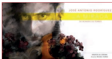
Portada del espectáculo, dedicado a Julio Romero de Torres, y que se estrena en el Festival de la Guitarra de Córdoba.

► ¿Cuál es el relevo generacional de la guitarra?