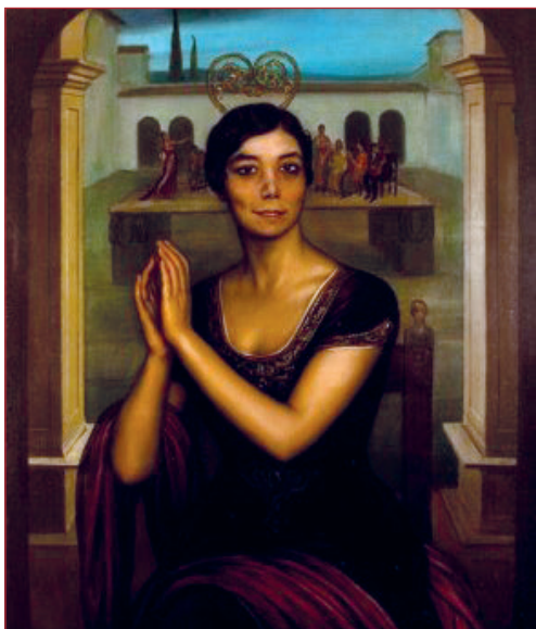
La Niña de los Peines (1917-1918)

La Niña de los Peines (Pastora Pavón, Sevilla, 1890-1969) fue retratada por Julio Romero de Torres, entre 1917-18 en el esplendor de su éxito. El retrato tiene como fondo la