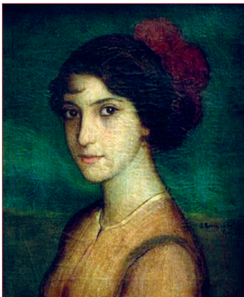
La Argentinita, 1915, Museo de Julio Romero de Torres, Córdoba

El óleo de Romero es pequeño, con fondo verde y rojo donde destaca la delicada figura de una joven Argentinita.