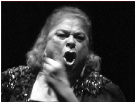
La Paquera

ciosísima bailadora Concha la Carbonera, y la otra o el otro, lo que fuera (aunque yo me creo que de hombre no tenía más que la ropa), era conocido por la Escribana”.