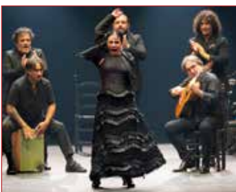
Eva Yerbabuena por @LauraLeón para la Bienal de Sevilla

E n la 74 edición del Festival de Música y Danza de Granada que se celebra durante los meses de junio y julio se han programado tres espectáculos de flamenco: Muerta de amor , de Manuel Liñán (24 de junio); Origen , de Patricia Guerrero con Fahmi Alqhai (25 de junio); y A Granada , de Eva Yerbabuena (10 de julio). Además, dos grandes voces completan la oferta de flamenco: Israel Fernández (29 de junio) y Ángeles Toledano (8 de julio).