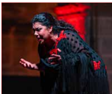
La Macanita recibirá este año el Premio, foto de @RinaSraborian

E l Festival Flamenco Tío Luis, El de la Juliana, es único, ejemplar y singular por destacadas razones. Se trata del festival flamenco