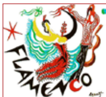
Premio homenaje de música al flamenco