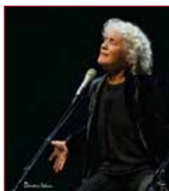
Mayte Martín