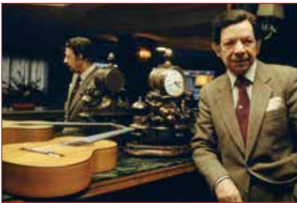
Sabicas