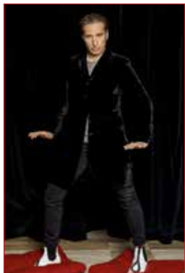
Israel Galván

que en El Dorado (que se podrá disfrutar en el Teatro Federico García Lorca de Getafe) se zambulle en el ritmo flamenco que marca la percusión de las palmas.