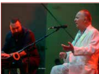
El Pele @ToniBlanco

F lamenco Real es el ciclo de flamenco del Teatro Real de Madrid, una forma única de disfrutar del flamenco en un espacio íntimo y selecto.