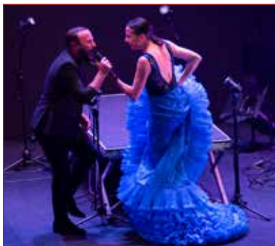
La Piñona por @TamaraPastora

S in demasiados estrenos absolutos o de importancia, el XXIX Festival de Jerez, celebrado recientemente, ha vuelto a ofrecer un escaparate de las tendencias y creaciones en la escena del baile flamenco y de la danza clásica española, con algunas de las más destacadas obras estrenadas el año anterior. En general, sigue llamando la atención la incesante creatividad de nuestros y nuestras artistas de la disciplina, su inquietud por mostrar su arte con una idea motriz nueva, con un formato distinto y, a ser posible, innovador, y arriesgando en la mayoría de los casos.