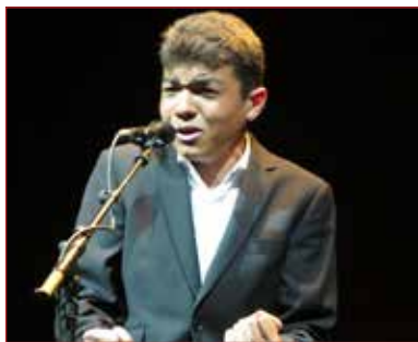
El Boleco @zocoflamenco

Hoy día esto del oficio, esto del comienzo de la carrera artística viene precedido de otras realidades materiales. Muchos son los jóvenes que comienzan en el flamenco impulsados por iniciativas públicas y privadas, apoyados en becas de instituciones que les ofrece una red económica, de contacto y de formación