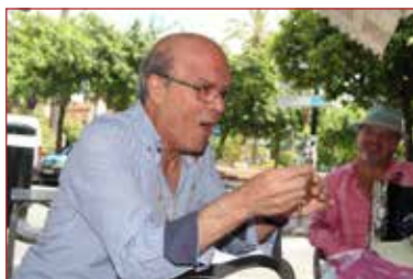
El Pijo @pepesalas

L os últimos meses de 2025 se vistieron de luto con el fallecimiento de cantaores tan queridos por la afición como El Berza, El Mijita y El Pijo